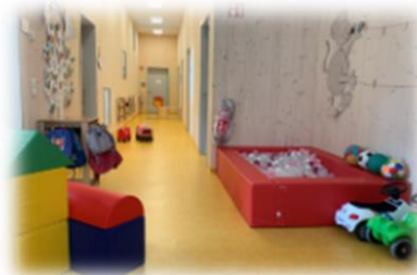
Spielbereiche des Kindergartens und der Krippe am Gang