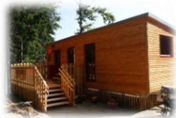
Bauwagen am Waldgelände Wurzelzwerge

Zusammen werden wir lachen, tanzen, spielen und singen, und so manche Bastelei nach Hause bringen.