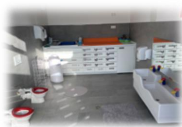
Bad der Kindergarten- und Krippenkinder