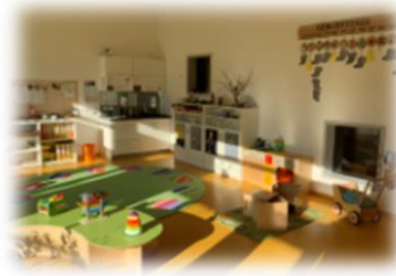
Gruppenräume der Wurzelbasis, der Wurzelwichtel und der Wurzelmäuse

Auf dem Bewegungsgang warten schon viele Fahrzeuge und tolle Spielecken!