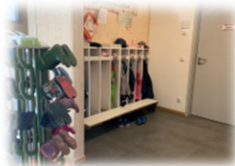
Garderobe des Kindergartens und der Krippe